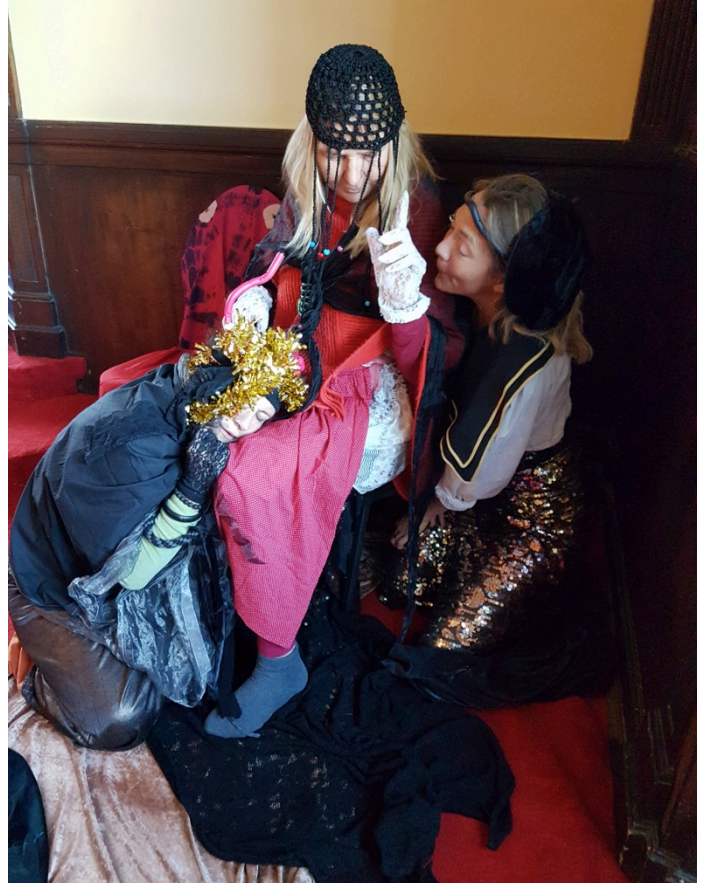
Aus dem Spiel: „Der Teufel mit den drei goldenen Haaren.“

Nach einem Ausdrucksspiel ist der Wunsch sich mitzuteilen, besonders intensiv. Dieses "Angefüllt Sein" von Eindrücken und Erlebnissen durch das Spiel, wird im Nachgespräch aufgegriffen. Jetzt ist Zeit zu berichten, zuzuhören, sich auszutauschen oder auch zu schweigen.