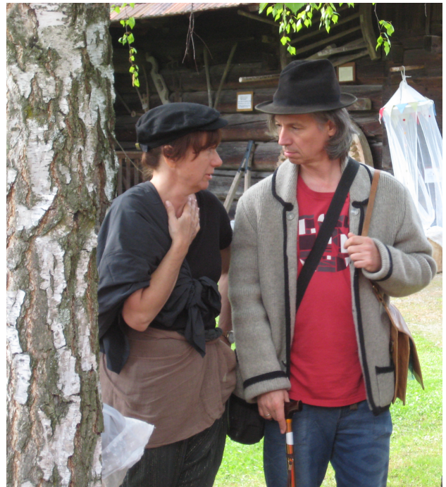
Aus dem Spiel „Das Leben der Bauern um 1900 – Soll ich? Aufbruch?“